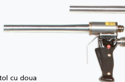
Pistol cu doua furtunuri G5000