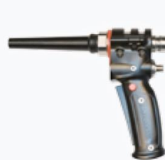
Pistol cu un furtun MG1004