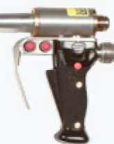
Pistol cu doua furtunuri G5000R ①