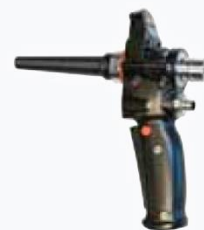
Pistol cu un furtun MG1004R ①